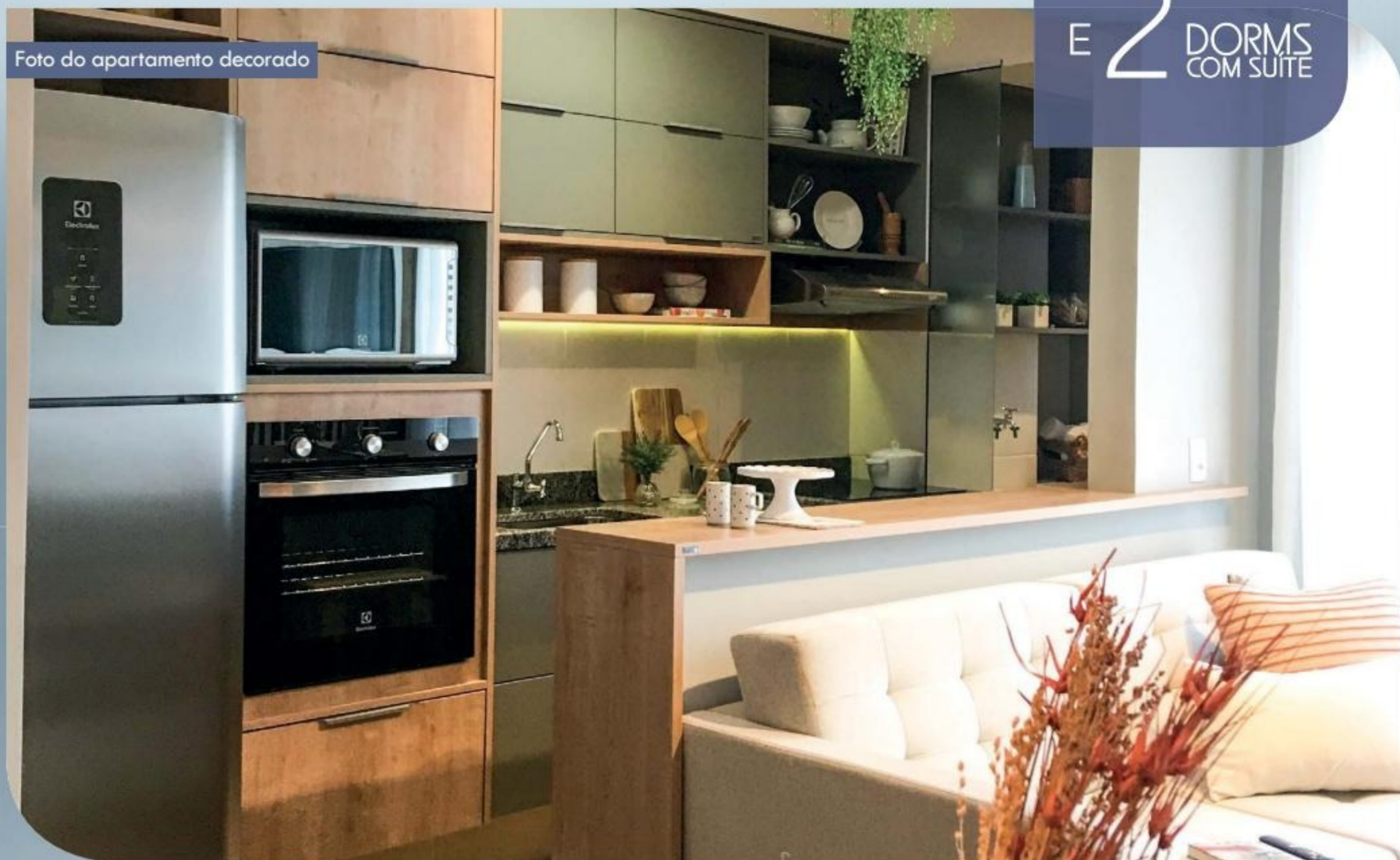
Foto do apartamento decorado