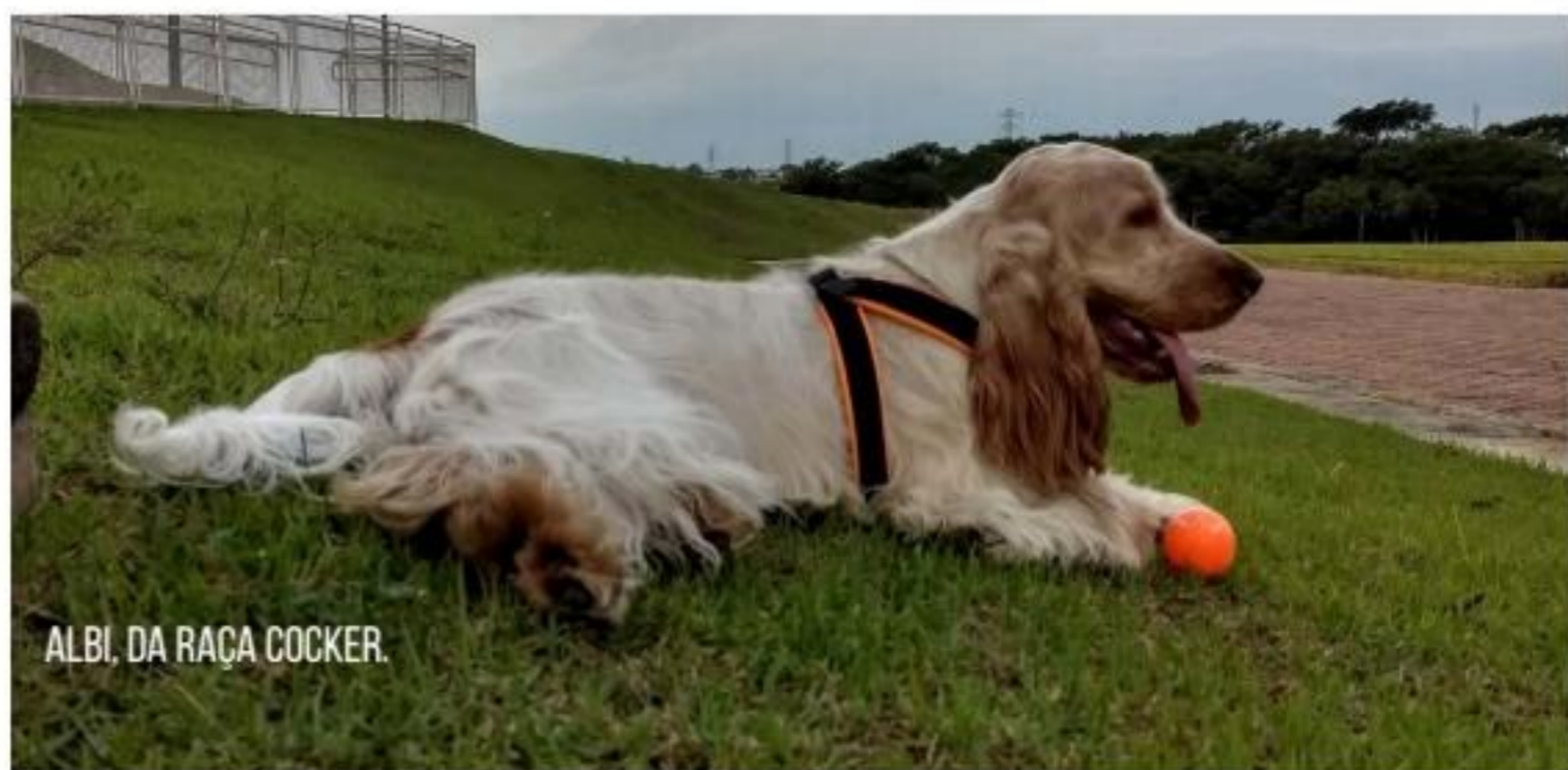
ALBI, DA RAÇA COCKER.