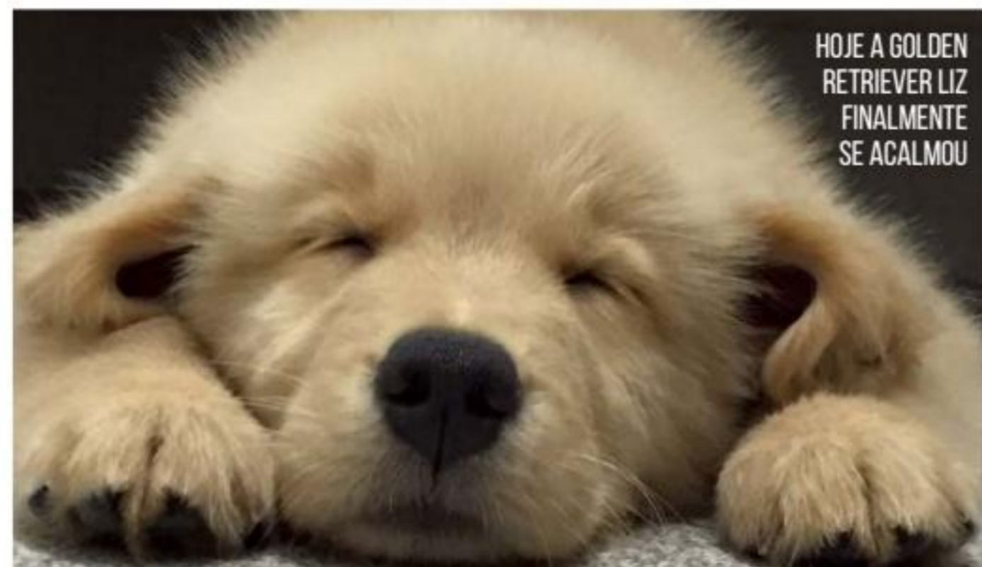
HOJE A GOLDEN RETRIEVER LIZ FINALMENTE SE ACALMOU