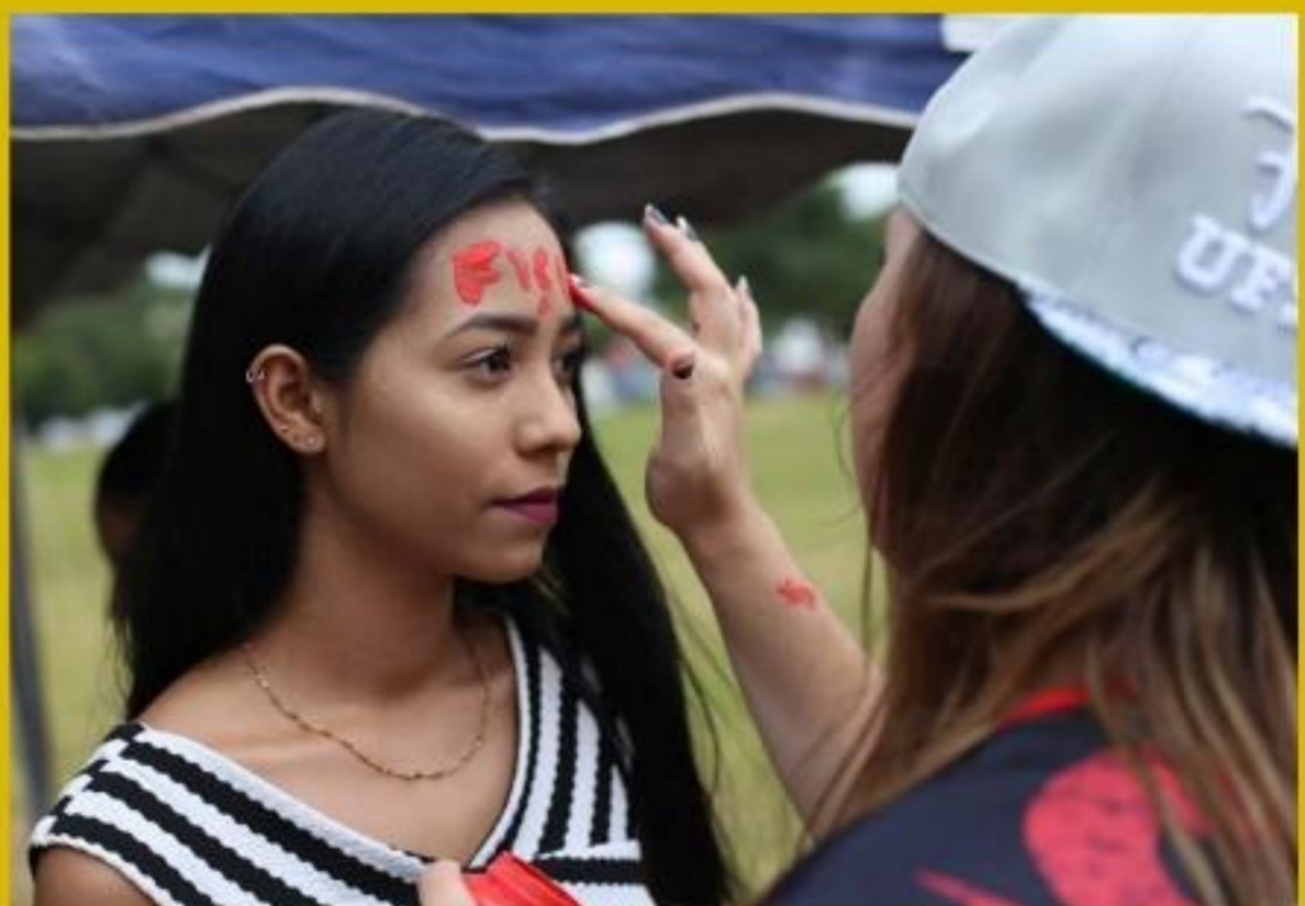
A ALEGRIA DA CONQUISTA

As Universidades de São Carlos oferecem apoio aos estudantes que estão chegando à cidade. Saiba mais no nosso blog